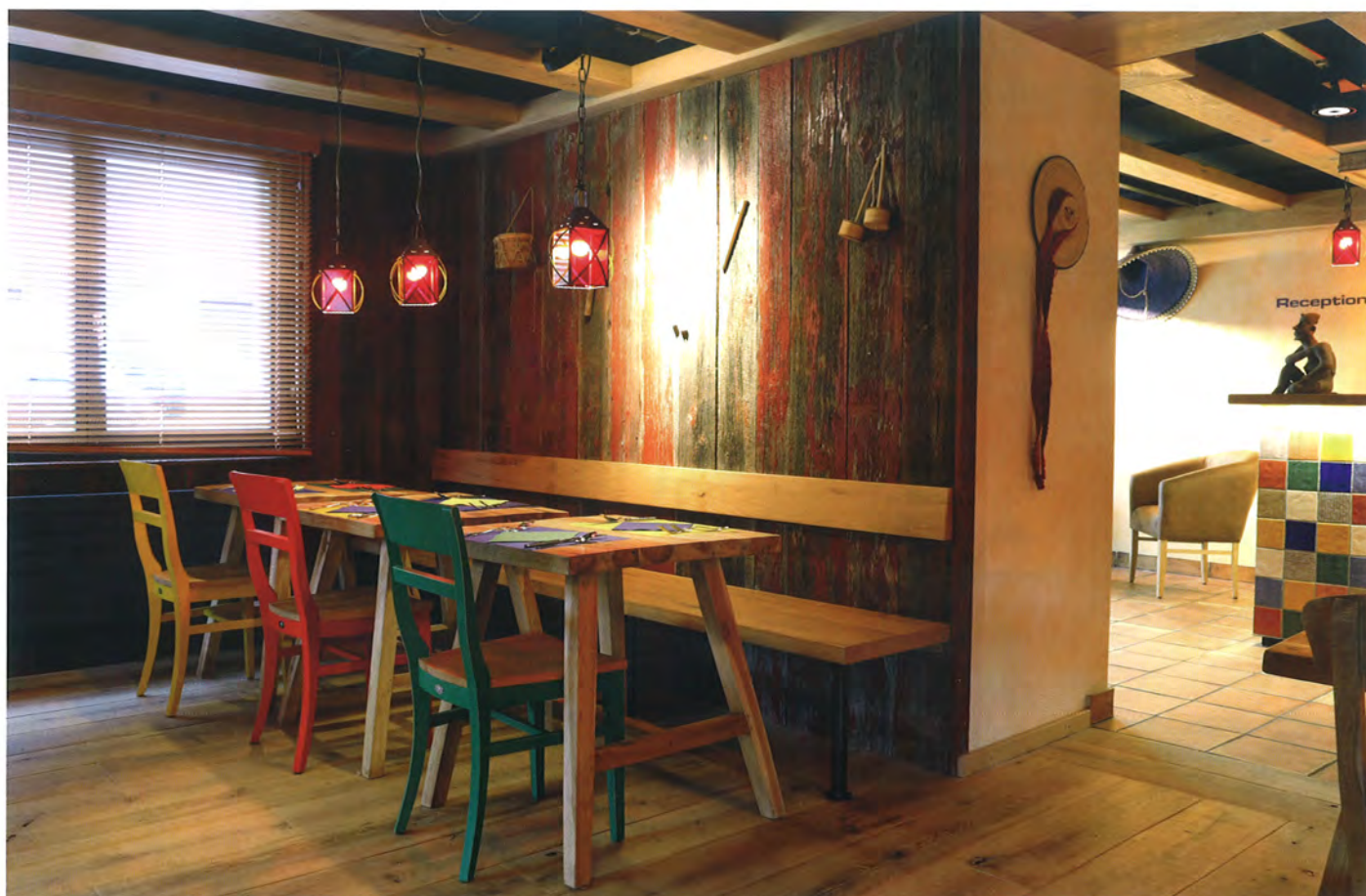
▲ Das „El Mäx“ lädt zum Zwischenstopp inmitten von bunten, handgemachten Fliesen und Stühlen ein

gen ganz klar eines: Gold. Wände, Säulen und Bar erstrahlen in der Farbe des Edelmetalls. Einzig Stühle und Barhocker geben mit ihrem warmen Rot gemeinsam mit den dunklen Wenge-Farbtönen der Holzmaterialien einen Kontrast zu den „Gold“-Tönen des Raumes. Das Restaurant „Wolke 7“ überzeugt dagegen mit seinem nostalgischen Charme, ist es doch dem