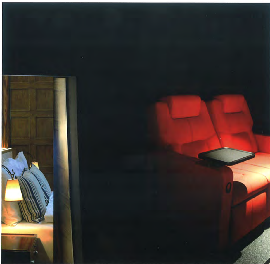
▲ Einzigartig: Die eigene Verbindungstür vom Hotelzimmer in eine private Kinologe