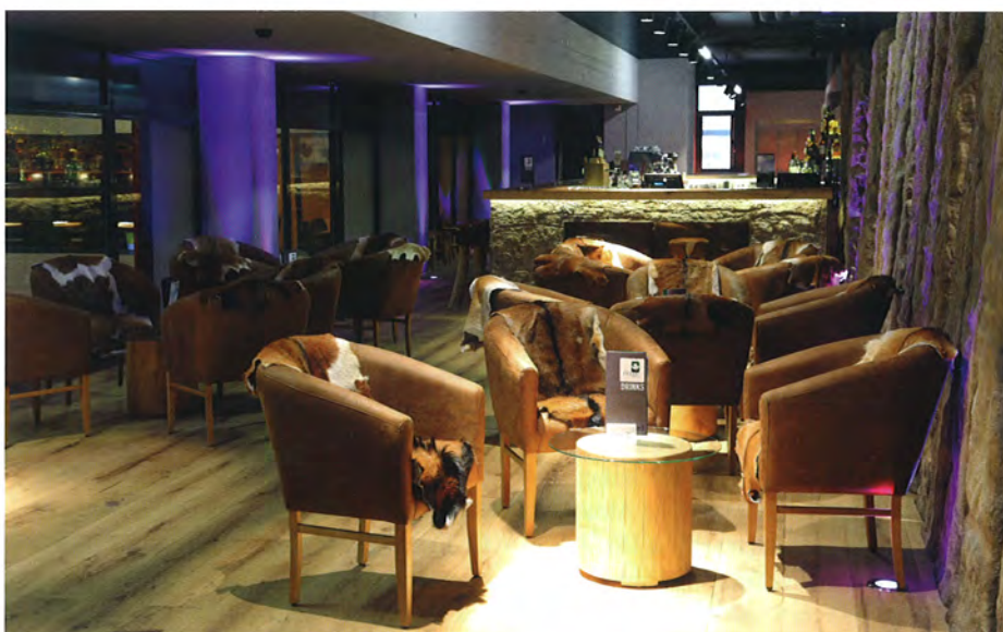
▲ In der First Celtic Lounge prägen Stein, Felle, Leder und Lagerfeuer das Ambiente

Daran schließt sich ein Diner im Stile der 50er Jahre mit türkis-weiß gestreiften Ledermöbeln, knallroten Stoffwänden mit großen Beleuchtungsflächen und einem bunt gestreiften Boden an. Und auch die hauseigene Brauerei legt Wert auf Bodenständigkeit und Tradition. Alles in allem ist die Erlebniswelt ein eigenes Universum, dessen Konzept aufgeht. ■