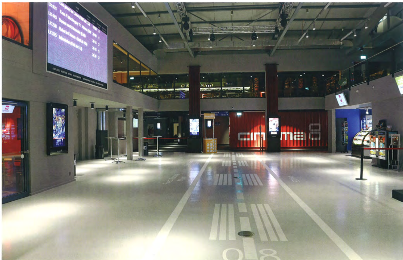
▲ Bereits die Eingangshalle des Kinos vermittelt das Thema „Abheben in eine andere Welt“