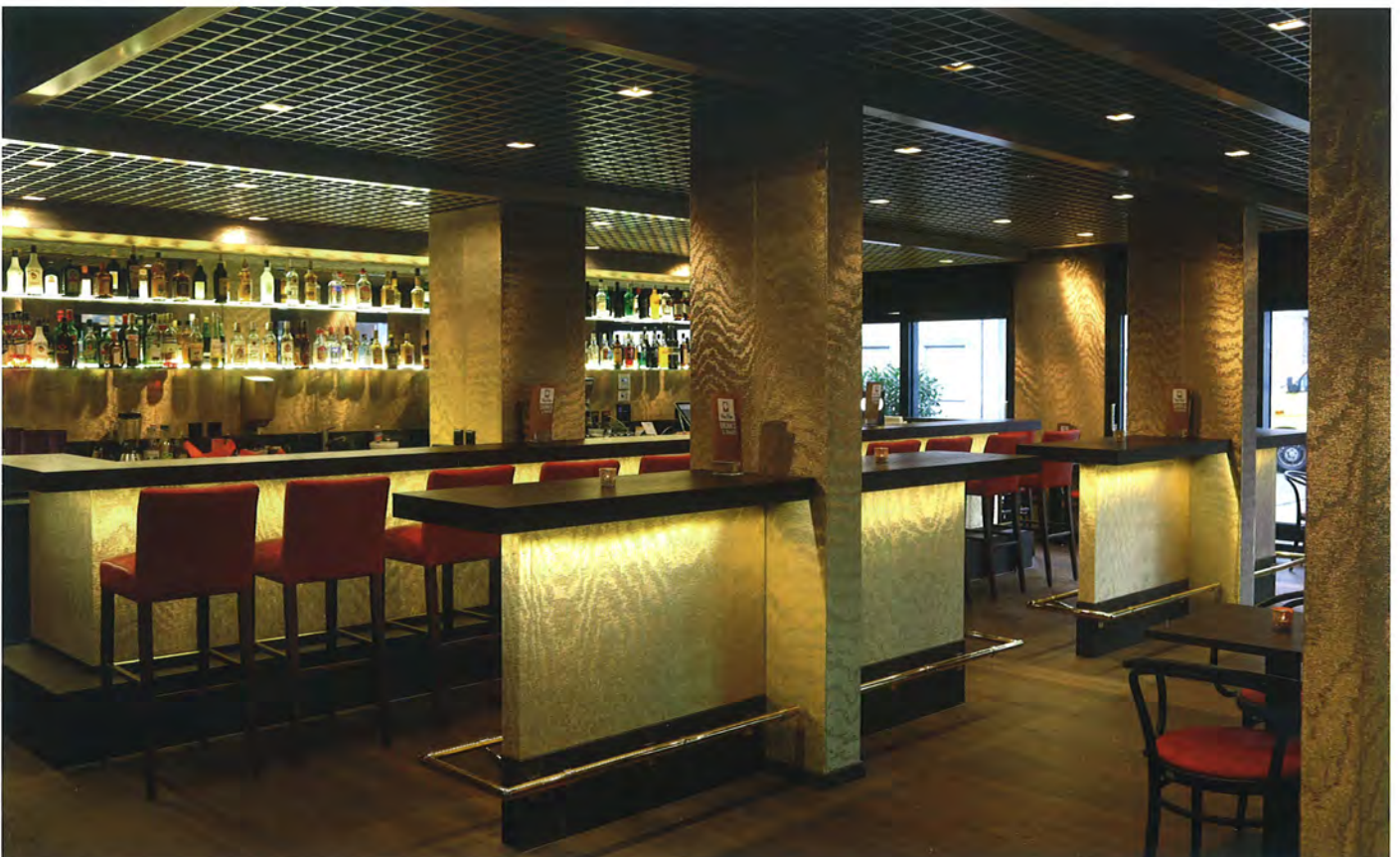
▲ In der „Bye Bye Bar“ dominiert Gold: Wände, Säulen und Theke erstrahlen in der Farbe des Edelmetalls

Nach Durchschreiten der Eingangstür steht der Besucher inmitten eines Flughafengates. Das Foyer ist designt im Stil einer Startbahn, Tickets können am Check-In-Schalter gezogen werden, die Filme werden wie auf einer Ankunft-Abflug-Tafel in weißer Schrift auf blauem Hintergrund an den Monitoren angezeigt, die Snackbar ist ein Duty-Free-Shop, die Toiletten sind in einem Übersee-Container angesiedelt und eine Rolltreppe führt zu kulinarischen Genüssen aus aller Welt. Denn die verschiedenen gastronomischen Einrichtungen des Komplexes locken in fremde Länder. So lädt das mexikanische Restaurant „El Mäx“ zu einem kulinarischen Zwischenstopp inmitten von bunten Fliesen und Stühlen ein. Ansonsten verleiten liebevolle Details wie Altholz von original alten amerikanischen Scheunen, mexikanische Kunstgegenstände und Musikinstrumente zum Träumen. In der „First Celtic Lounge“ dominieren Stein, Felle, Leder und Lagerfeuer in der Bar, die zusammen ein steinzeitliches, aber warmes Ambiente vermitteln. Auch hier hat Neumeier seiner Detailverliebtheit nachgegeben: „Für die angrenzende Zigarrenlounge haben wir mehrere hundert alte Zigarrenschachteln auf Auktionen ersteigert, mit denen der Raum nun dekoriert ist, und den Innenausbau in Zedernholz ausgeführt“. In der „Bye Bye Bar“ dominiert dage-