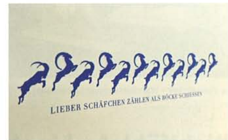
▲ Witzige Grafik an der Wand

Design realisiert werden“, beschreibt Neumeier sein Rezept. ■