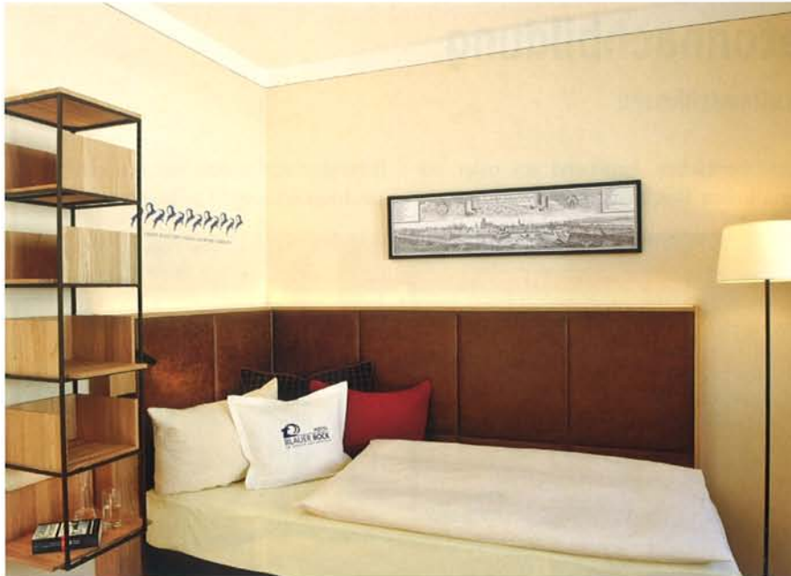
▲ Die Geschichte des Hauses ist überall spürbar

von der Grundkonzeption und Entwurfsplanung bis hin zur schlüsselfertigen Inneneinrichtung. „Wir legen stets großen Wert auf Authentizität und ein zeitloses Design, das dennoch ein Gestaltungsthema, den roten Faden, im Auge behält“, beschreibt Martin Neumeier die Unternehmensphilosophie. Besonders stolz sind Neumeier und sein Team natürlich auf die Konzeption und Einrichtung der fünf Themenhotels des Europa-Parks in Rust – heute das größte Hotelresort in Deutschland und mit zahlreichen Aus-